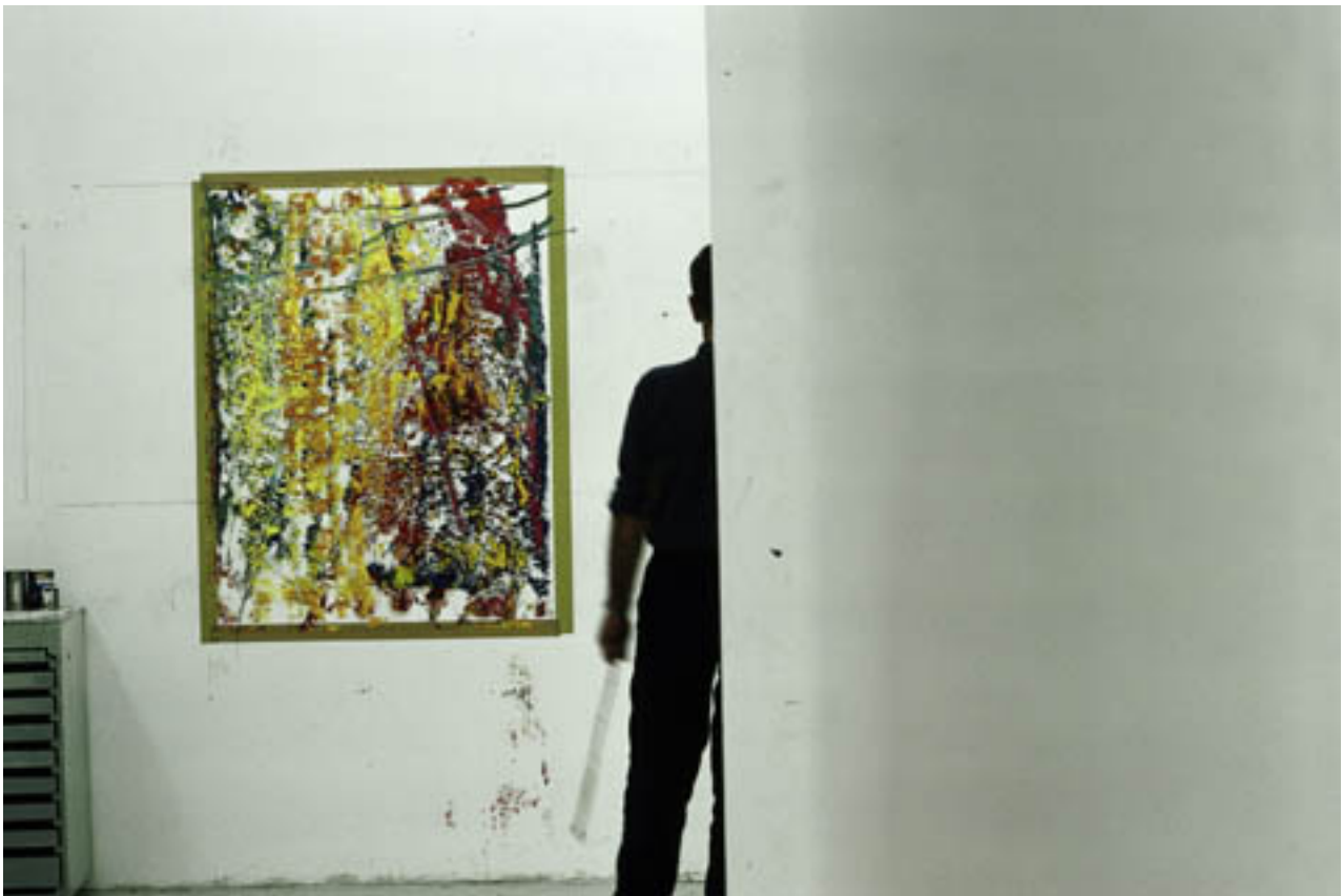
Gerhard Richter, Düsseldorf, 1986, 25x36cm, c-print