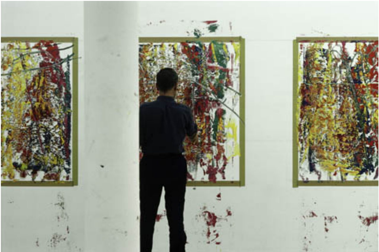
Gerhard Richter, Düsseldorf, 1986, 25x36cm, c-print