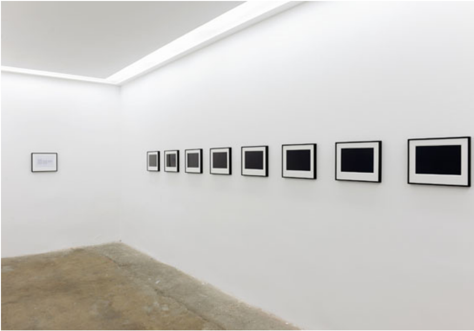
Richmond Highschool, 2010, 8 schwarzweiß Fotografien, gerahmt, je 29 x 36 cm, Bromsilbergelatine, 1 Text über Fotografie, 2