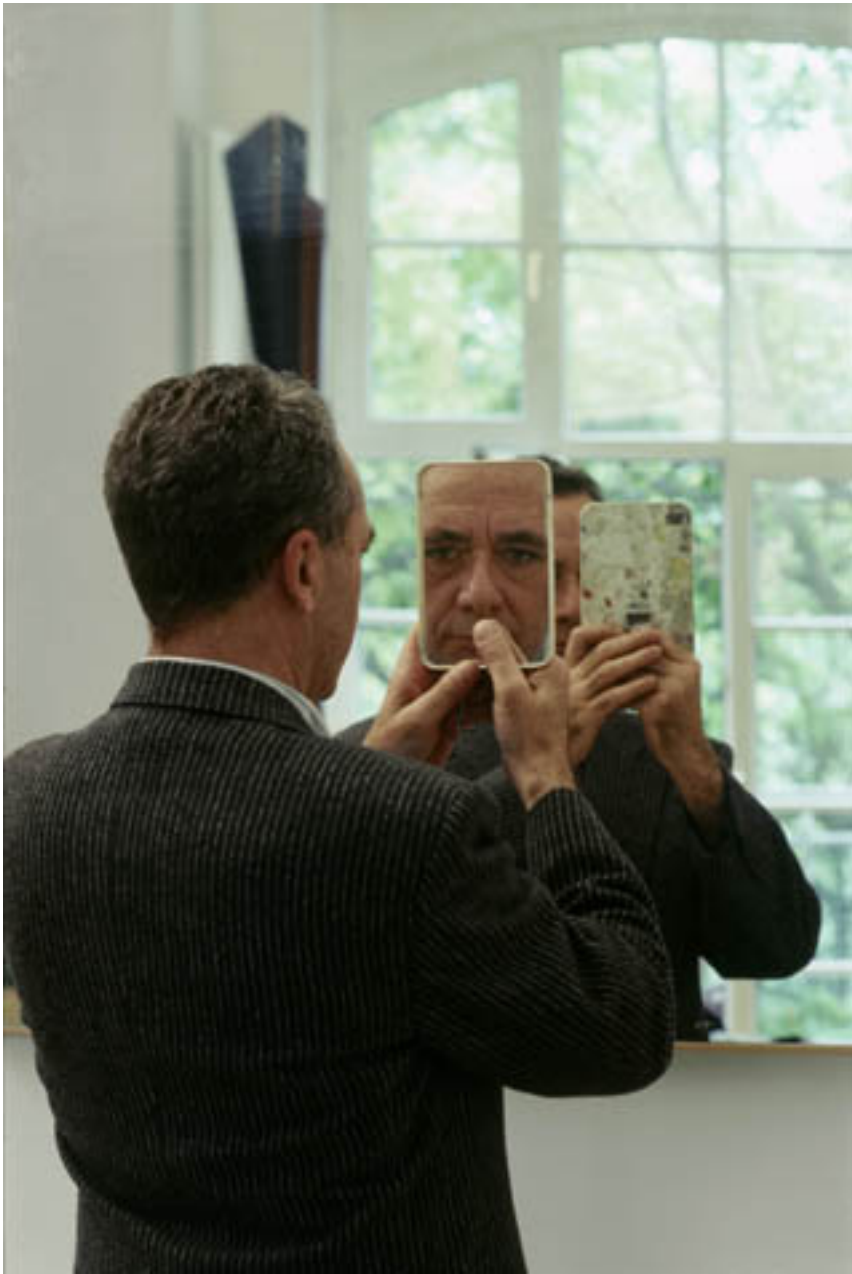
Gerhard Richter, Köln, 1986, 25x36cm, c-print