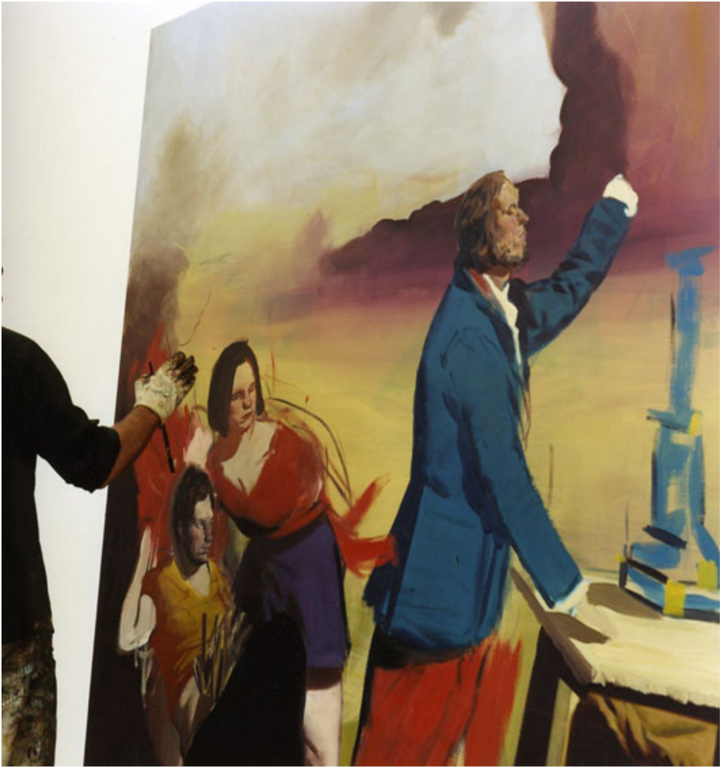
Neo Rauch, Leipzig, 2008 (Diptychon2), C-Print, je 49 x 49 cm