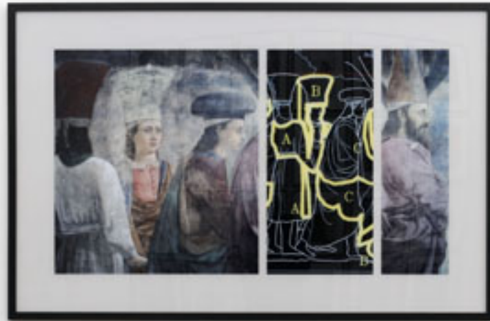
ABC , 2001, aus der Serie ARTWORK, c-print, gerahmt, 110 x 170 cm, Rückseitig signiert und datiert, Ed. 3 +1 a.p.