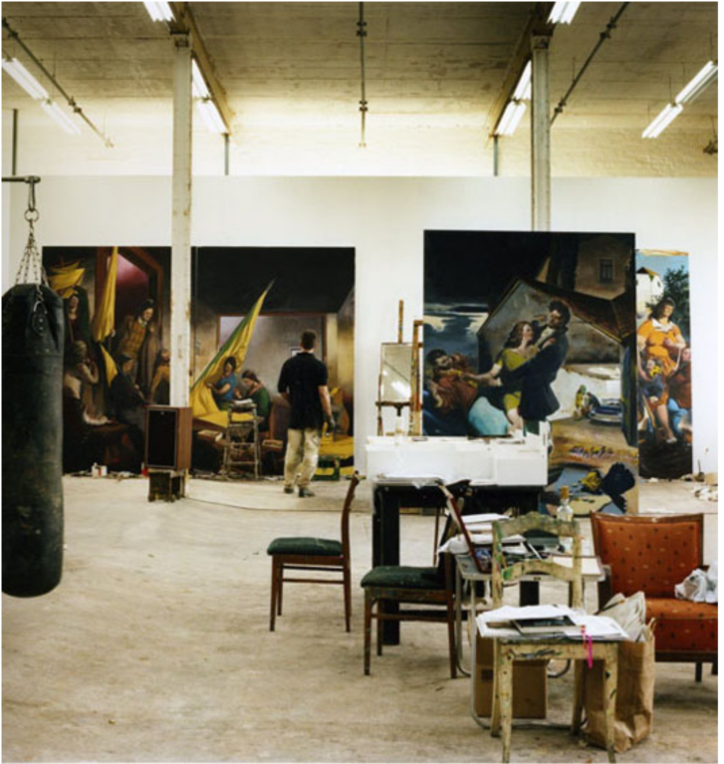
Neo Rauch, Leipzig, 2008 (Triptychon 1), C-Print, 49 x 49 cm, right