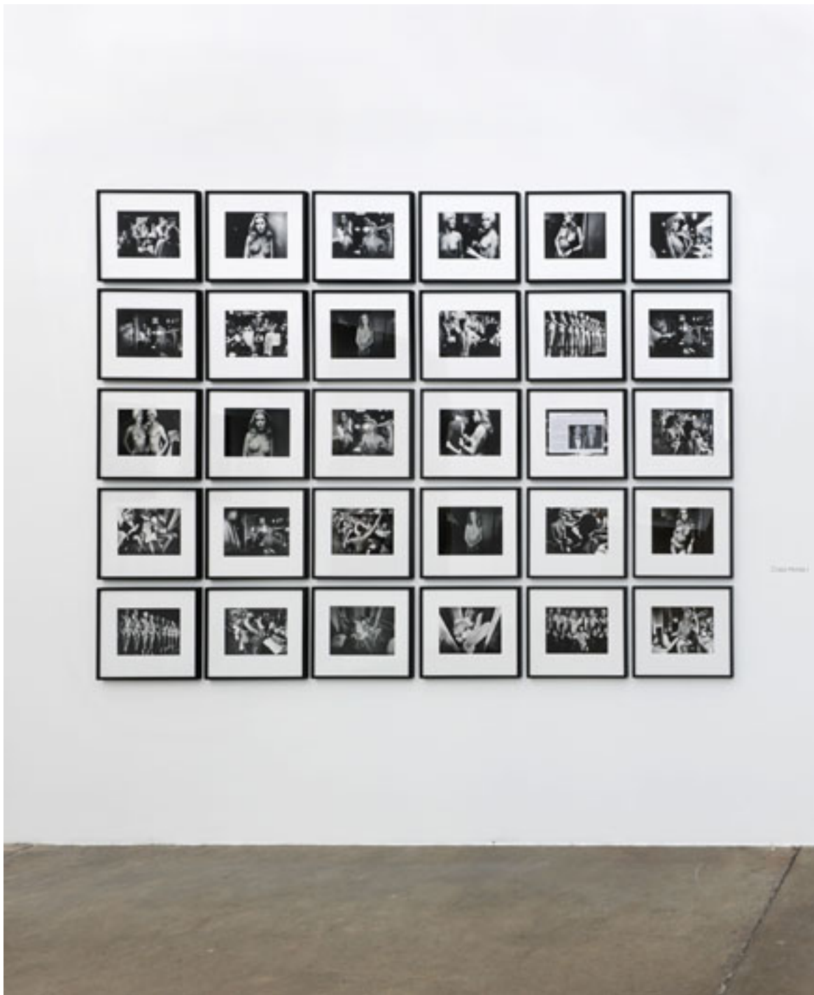
Crazy Horse I, 1974, 1994, 2004, 30 schwarz weiß Fotografien, je 32 x 40 cm, Bromsilbergelantine und Text