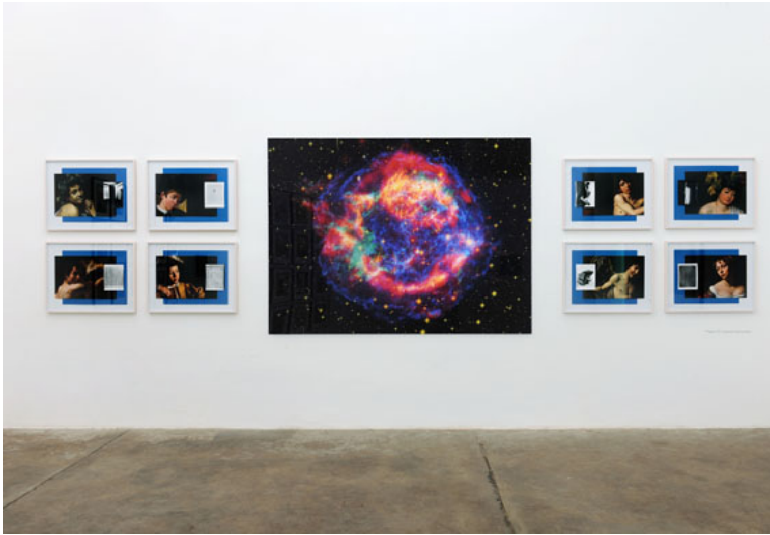
Property of A Distinguished Collector, 2010, 8 Farbcollagen, je 64 x 81 cm, gerahmt, mit je einer schwarzweiß Fotografie, Broms