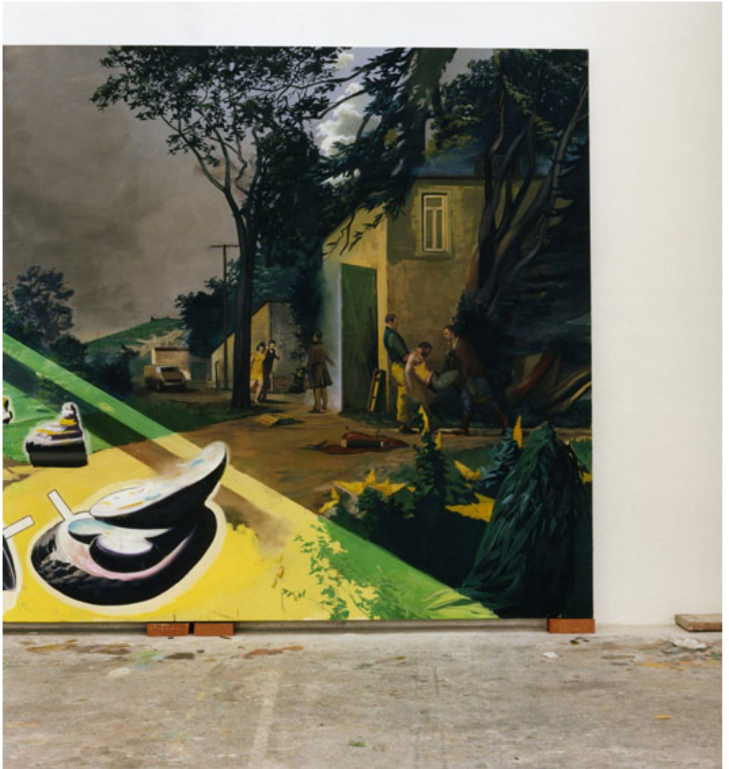
Neo Rauch, Leipzig, 2008 (Diptychon1), C-Print, je 49 x 49 cm