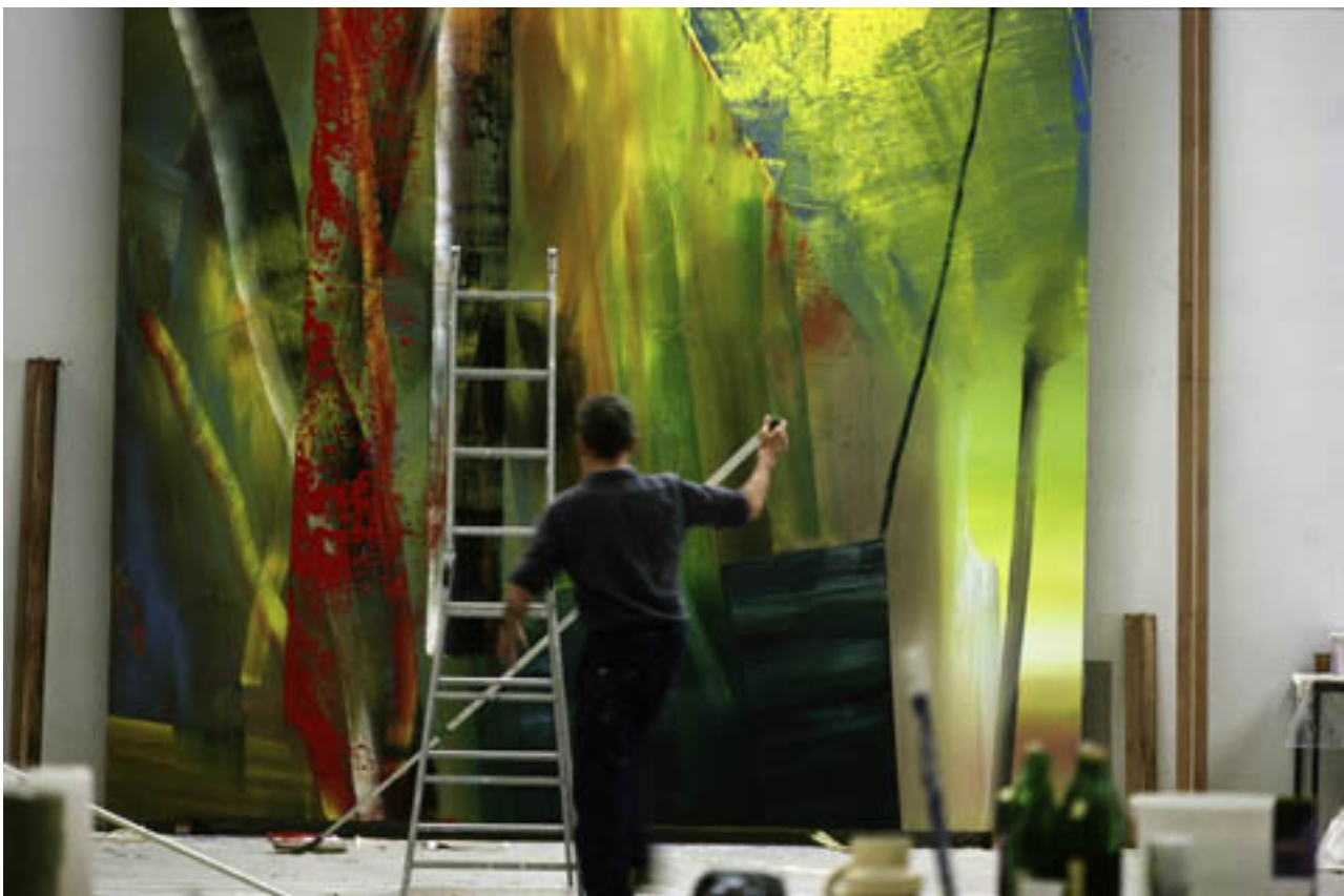
Gerhard Richter, Düsseldorf, 1986, 25x36cm, c-print