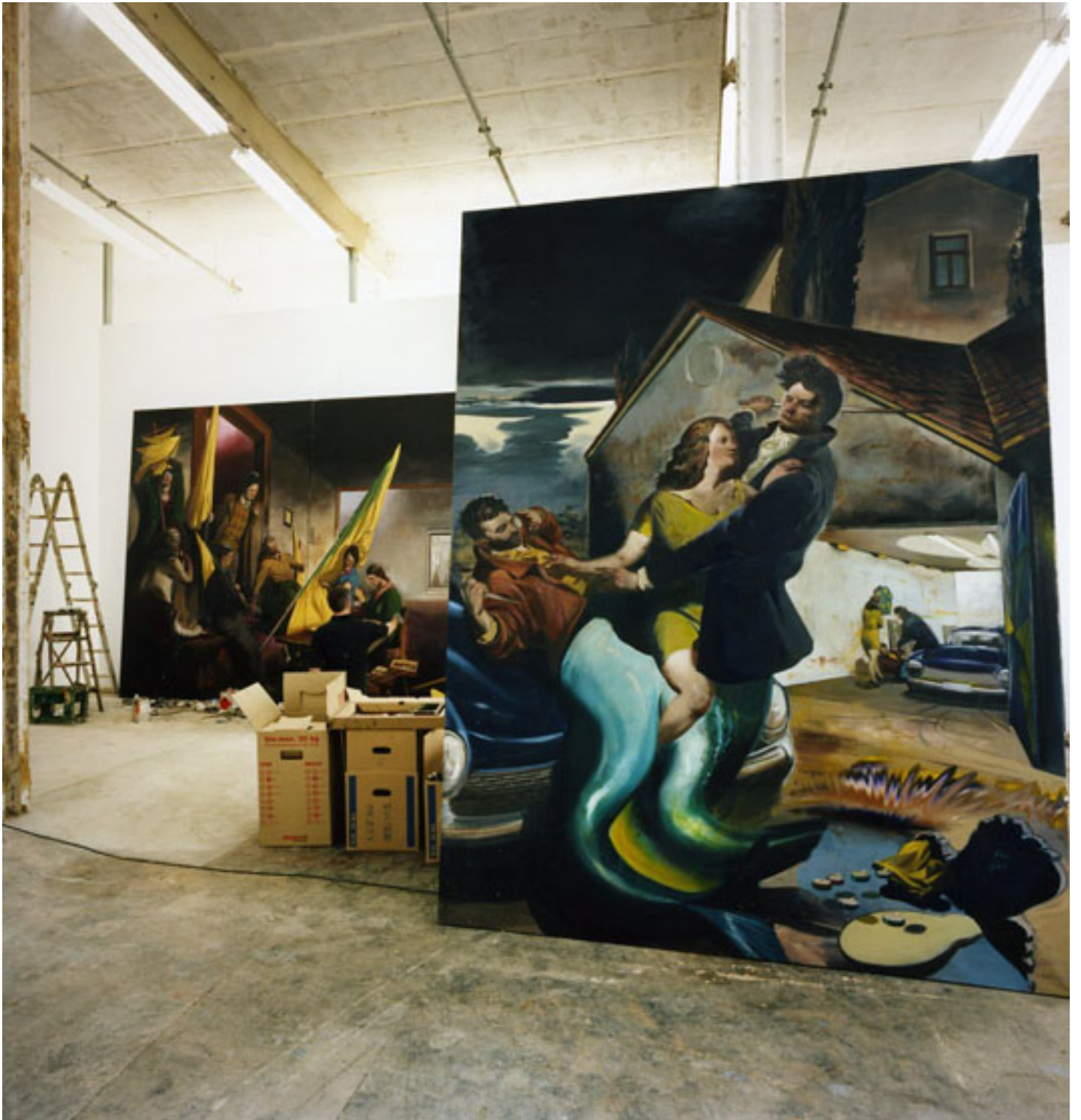
Neo Rauch, Leipzig, 2008 (Triptychon 1), C-Print, 49 x 49 cm, left