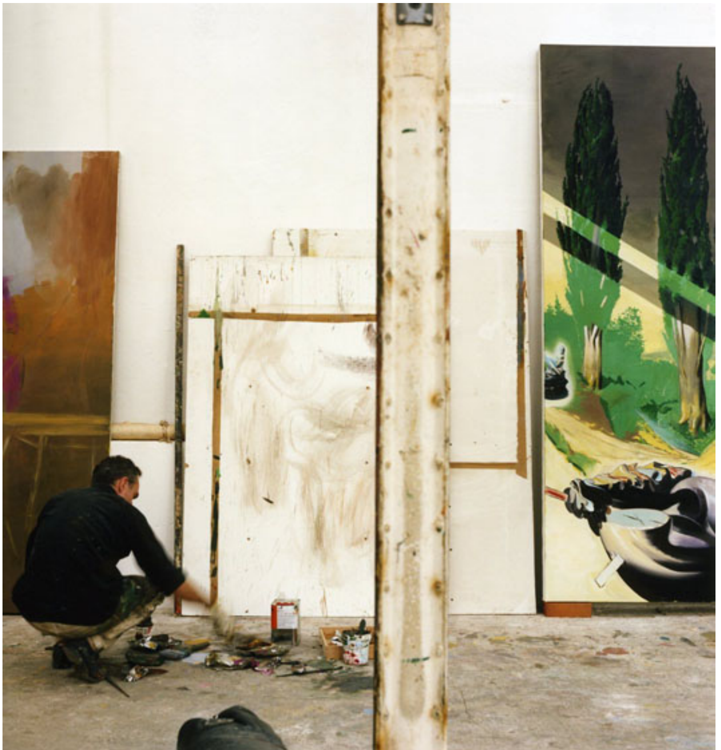
Neo Rauch, Leipzig, 2008 (Diptychon1), C-Print, je 49 x 49 cm