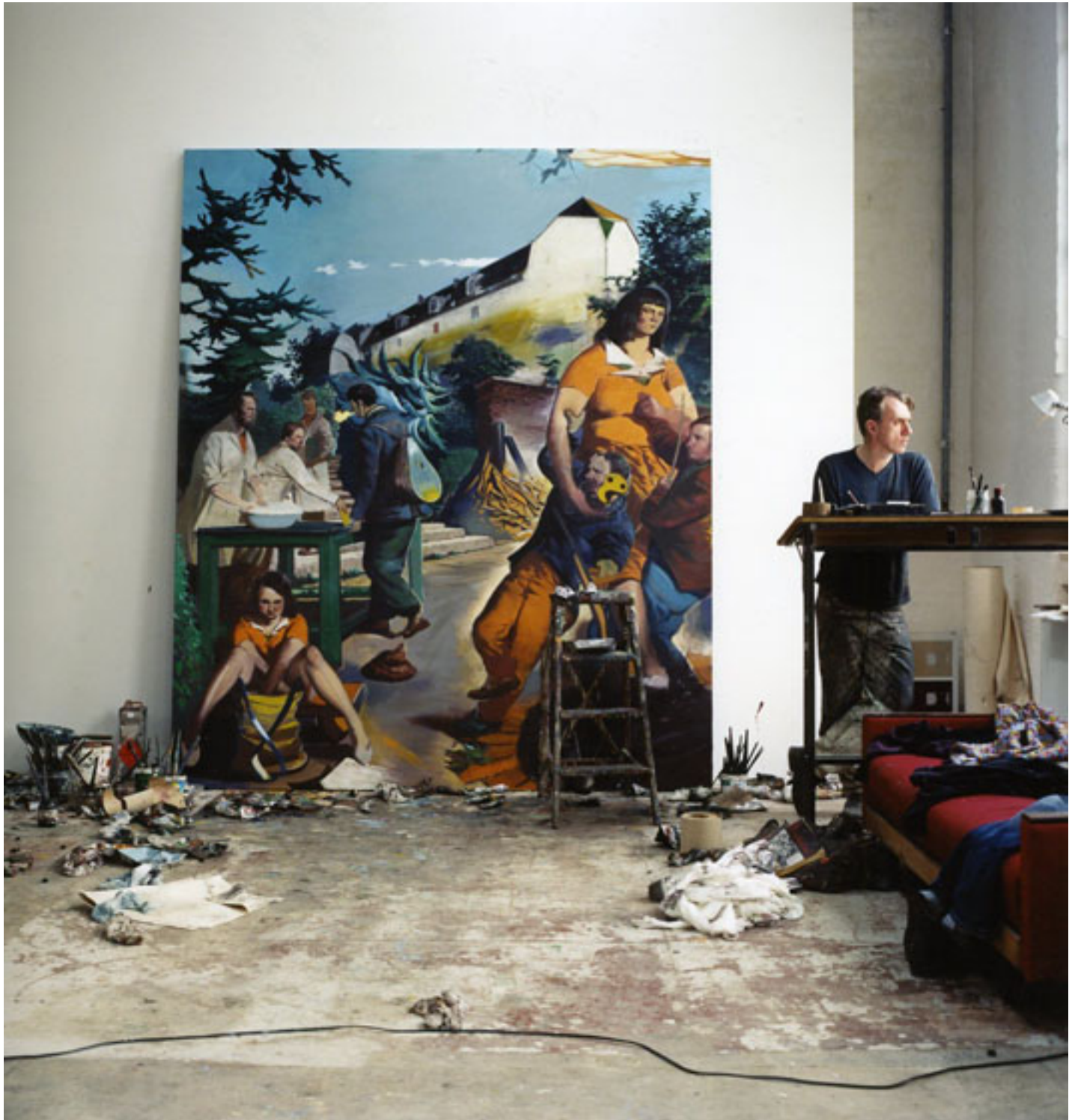
Neo Rauch, Leipzig, 2008 (Triptychon 1), C-Print, 49 x 49 cm, center