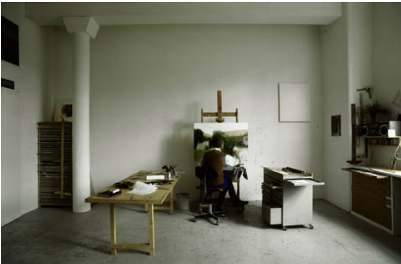
Gerhard Richter, Köln, 1986, 25x36cm, c-print