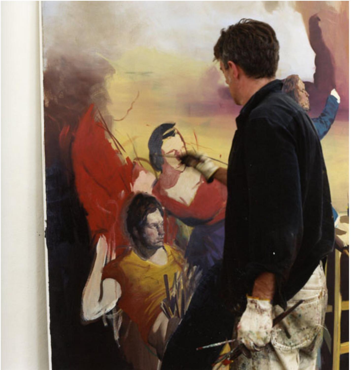
Neo Rauch, Leipzig, 2008 (Diptychon2), C-Print, je 49 x 49 cm