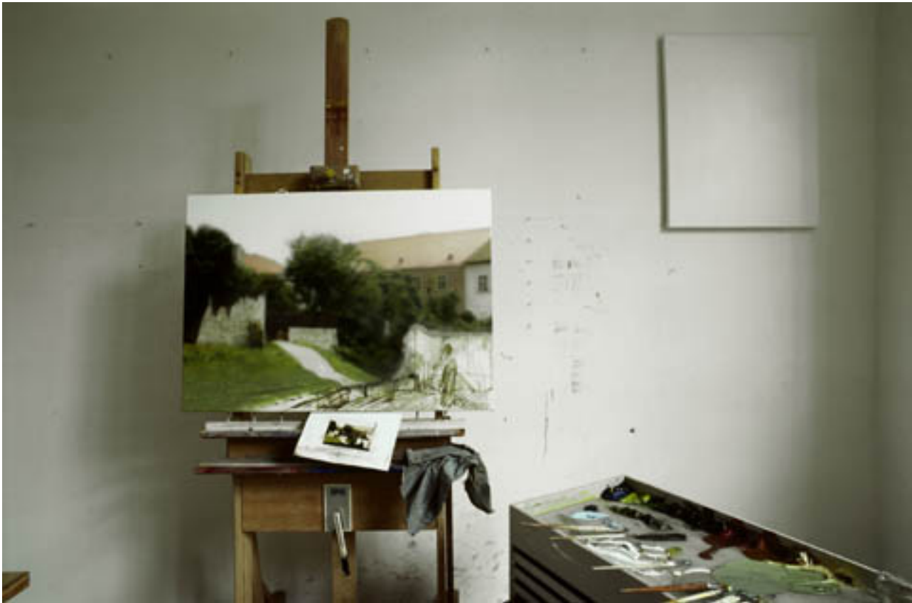
Gerhard Richter, Köln, 1986, 25x36cm, c-print