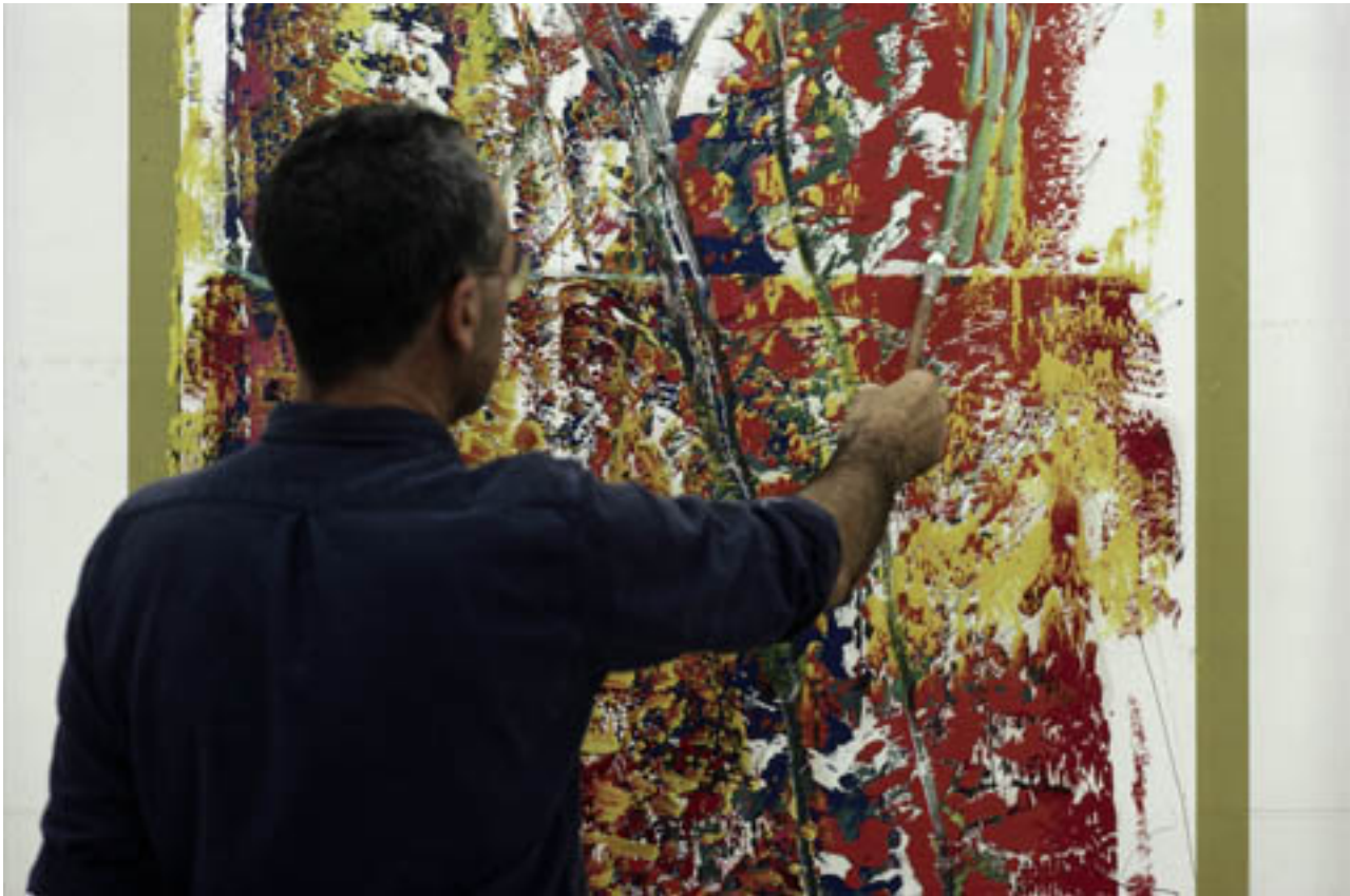
Gerhard Richter, Düsseldorf, 1986, 25x36cm, c-print