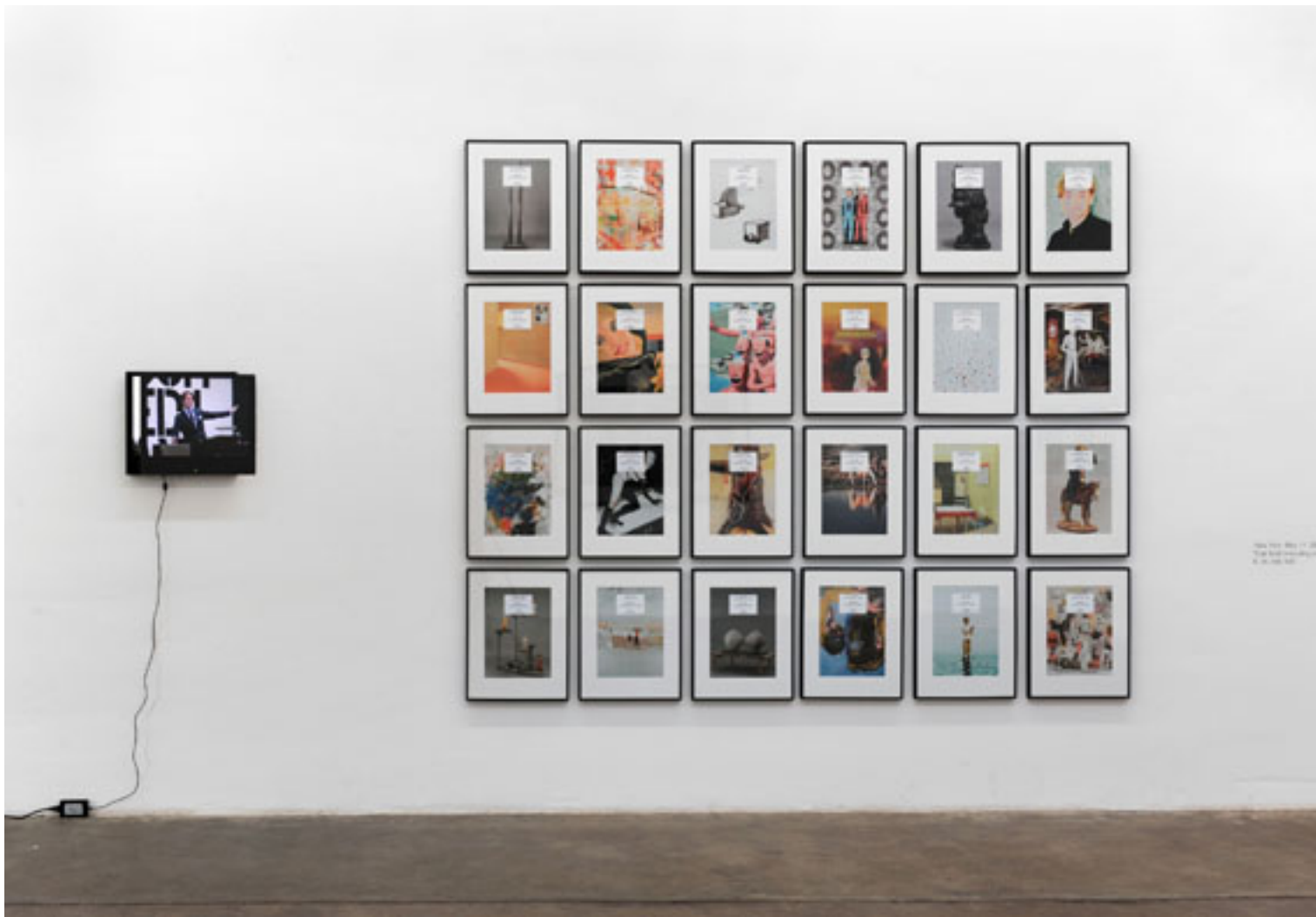
New York May 11 2006, Total Sold (including premium) $ 29.499.600, 24 Farbfotografien, 2006/2010, gerahmt, je 50 x 40 cm, c