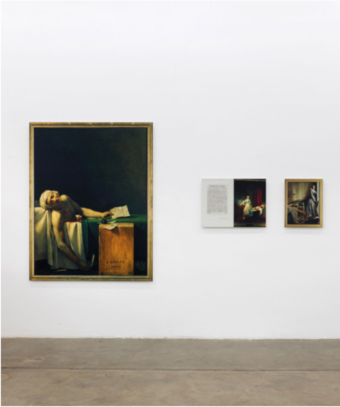
Niemand hat etwas gesehen, 2006, dreiteilig, 53x42cm, 53x70cm, 174x135cm, c-prints