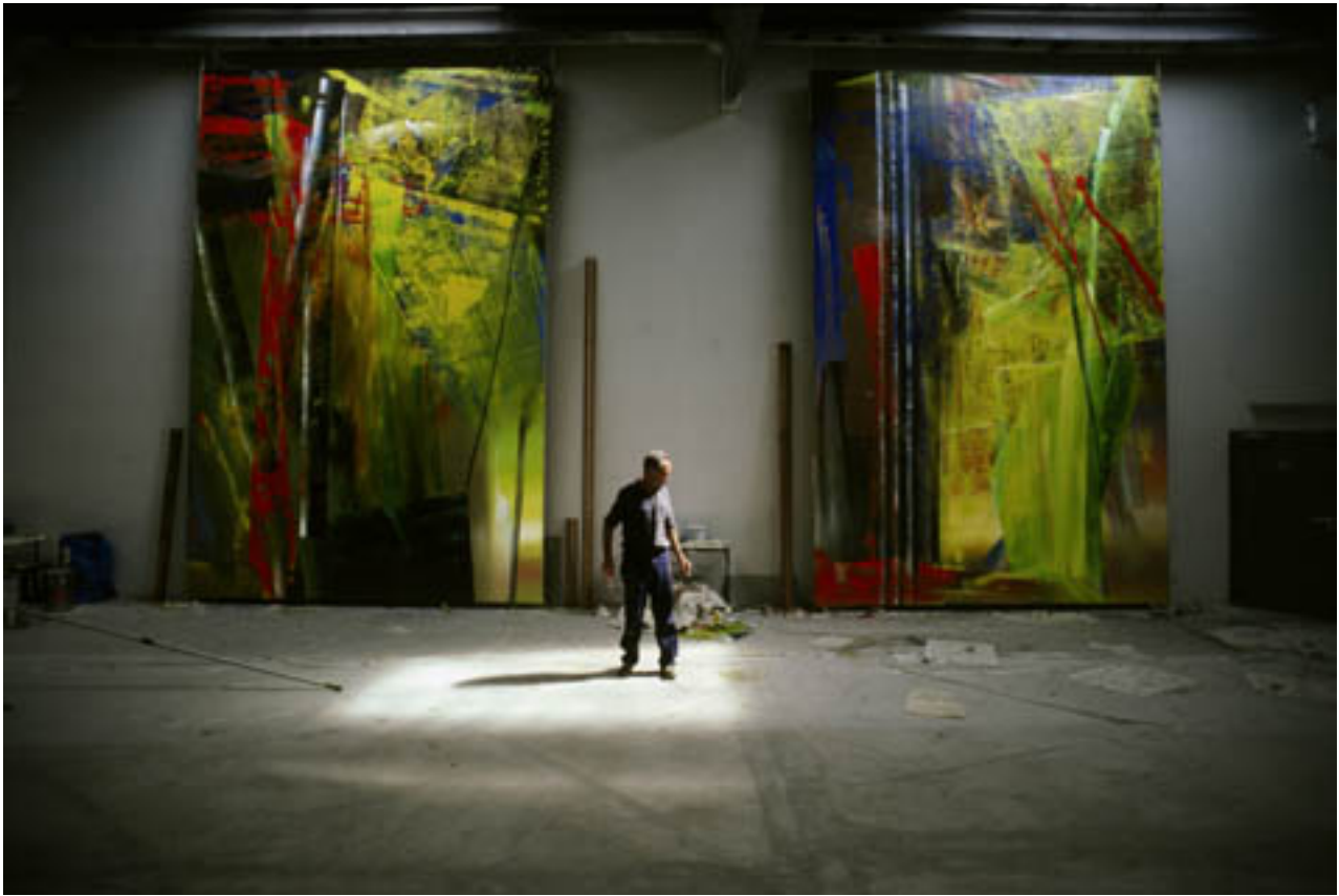
Gerhard Richter, Düsseldorf, 1986, 25x36cm, c-print