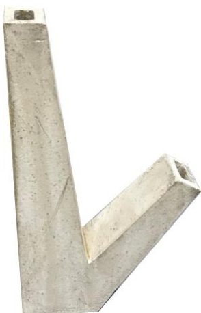
stud, 2020 47x26x6cm Keramik