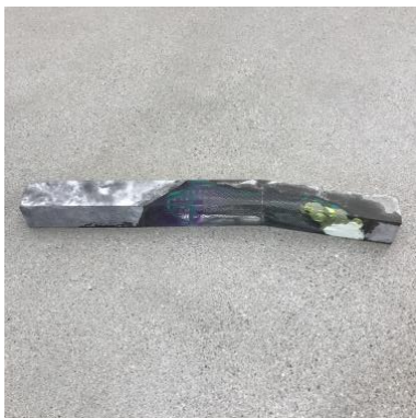
velvet, 2021 94x15x9cm mixed media