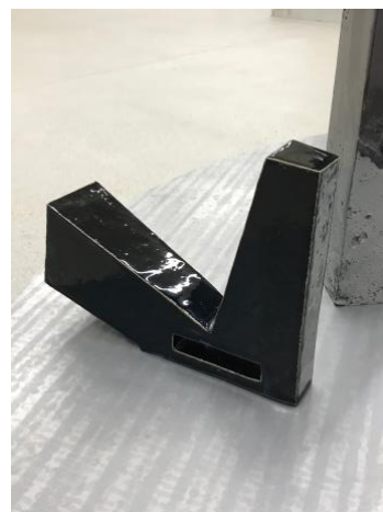
liquorice, 2020 29x22x7cm Keramik