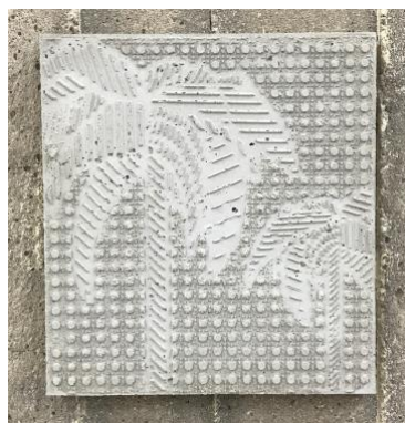
palm beach, 2021