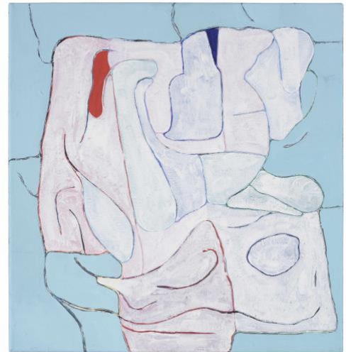
8 ohne Titel, 2019 Öl und Acryl auf Leinwand 85 x 80 cm