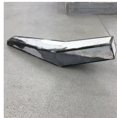
cassius, 2021 160x26x44cm mixed media