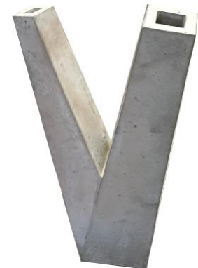
pearl, 2020 44x26x15cm Keramik