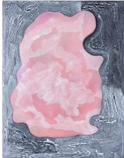
7 ohne Titel, 2015 Öl, Acryl und Tusche auf Leinwand 140 x 110 cm