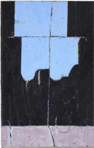
10 ohne Titel, 2019