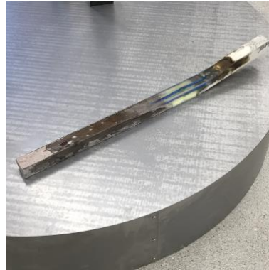
croc, 2021 84x4x9cm mixed media