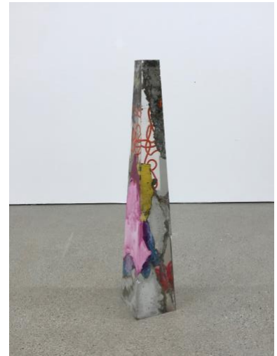
vario, 2021 9618x18cm mixed media