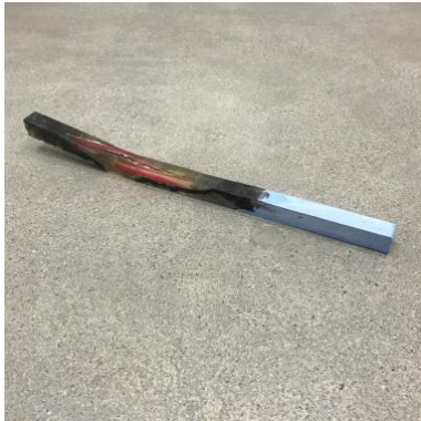
joint, 2021 81x4x9cm mixed media

Galerie Kleindienst Franz-Flemming-Straße 9, 04179 Leipzig 0341-4774553, kontakt@galeriekleindienst.de